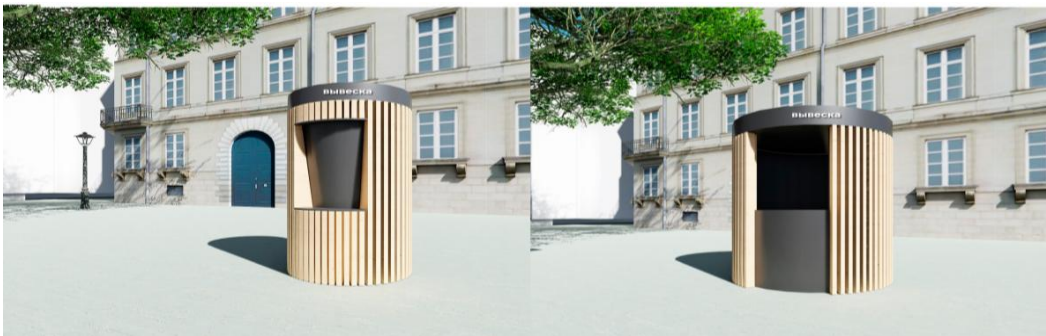
Павильон для фруктов и овощей